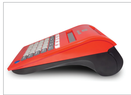
Forma compatta, linee curate e moderne