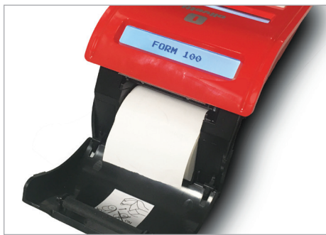
Inserimento rapido e agevole del rotolo carta